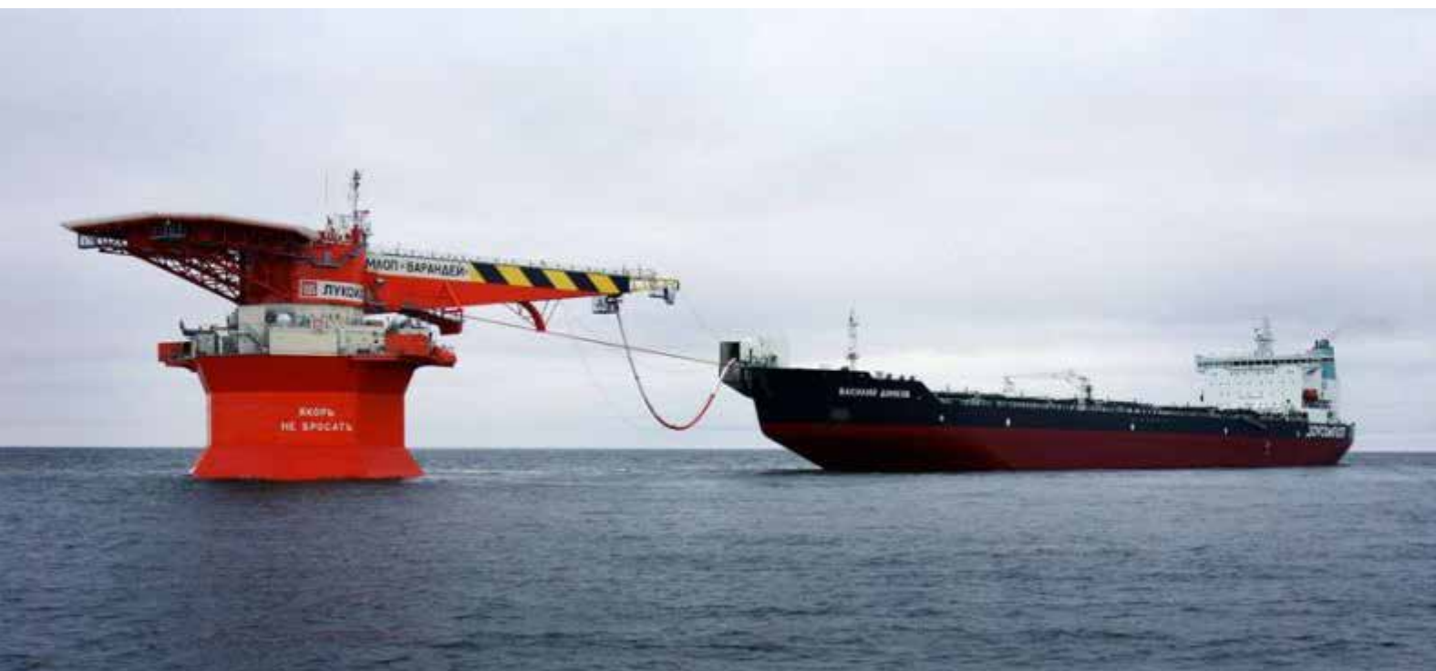
Варандејски терминал у Баренцовом мору

Вађење нафте на налазишту Кравцовскоје започето је 2004. године.