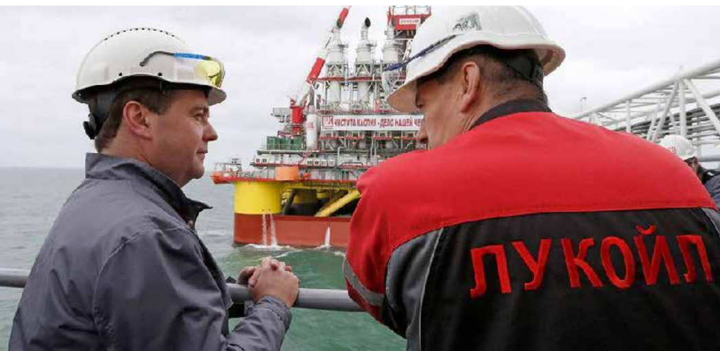
Премијер Медведев на платформи Јуриј Корчагин

Медведев је истакао јединственост и технолошку сложеност објекта, након што је имао прилику да се детаљно упозна са условима живота и рада на овој нафтној платформи. Цео процес надзире 35 камера у производном модулу и још 40 у стамбеном делу. Осим тога, на платформи је инсталирано 11 хиљада различитих сензора који контролишу рад објекта. Захваљујући овоме, у току три године, колико платформа ради, није се појавио ни један проблем везан за безбедност технолошких објеката. Премијер је сазнао да смена траје 12 сати дневно, а да се посаде мењају на 14 дана. Сазнавши да се на платформи користи тренутно најсавременија у свету норвешка опрема, Медведев је истакао да су спретне руке обучених професионалаца једнако важне.