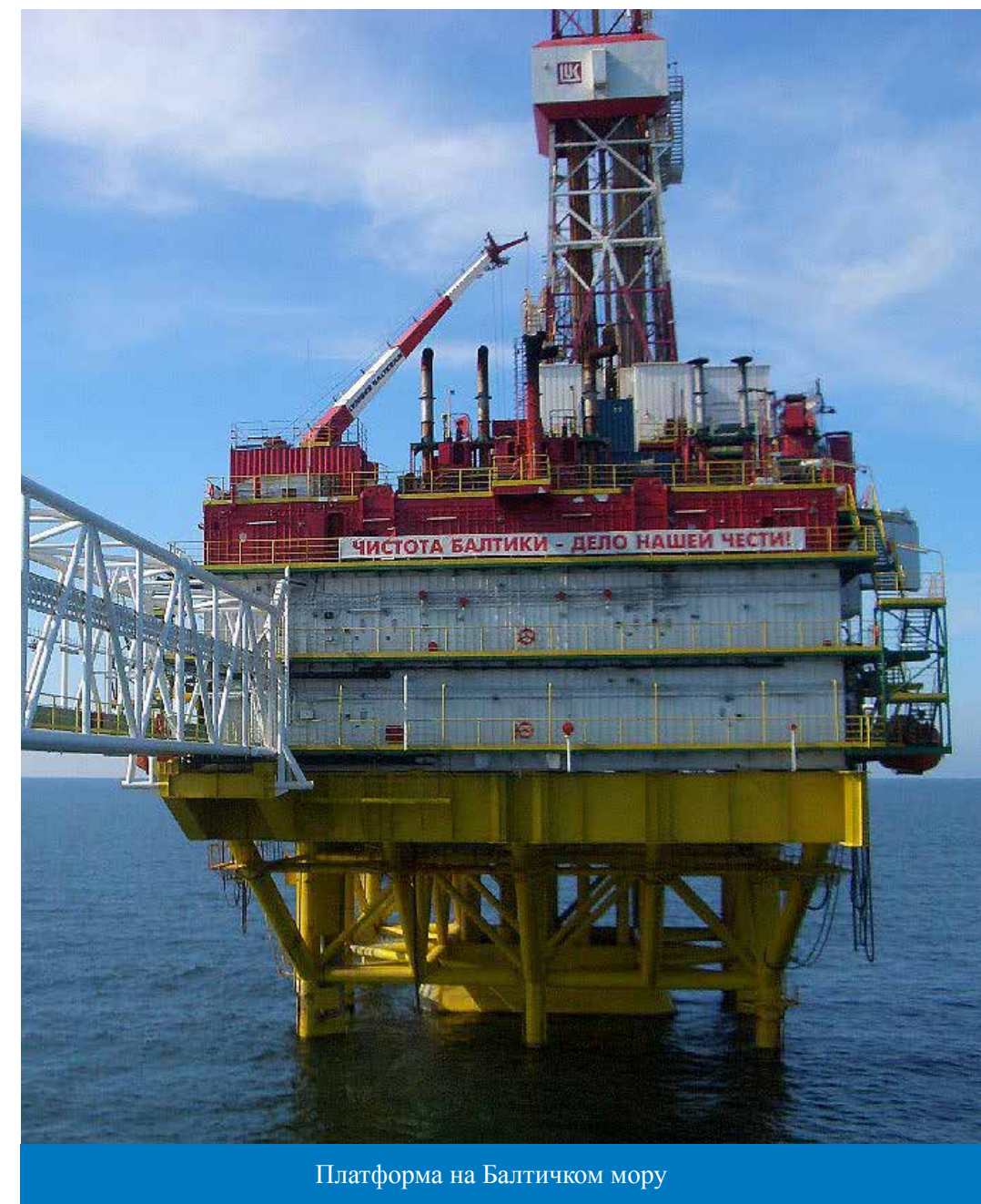
Платформа на Балтичком мору

Налазиште Јуриј Корчагин ЛУКОИЛ је открио 2000. године. Залихе нафте и гаса по категоријама ЗР премашују 270 милиона барела нафтног еквивалента. Максимални ниво производње на годишњем нивоу је 2,5 милиона тона нафте и једна милијарда кубних метара гаса.