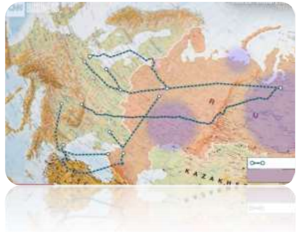
Foto: Mapa ruskih gasovoda u Evropi

MOSKVA - Dnevni izvoz gasa Gasproma iz Rusije u Evropu u aprilu je porastao za oko 7,5 odsto u odnosu na mart, uglavnom zahvaljujući povećanju tranzita preko Turske, pokazuju proračuni Rojtersa u utorak.