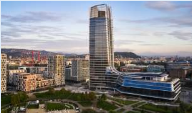
Novo sedište kompanije u Budimpešti