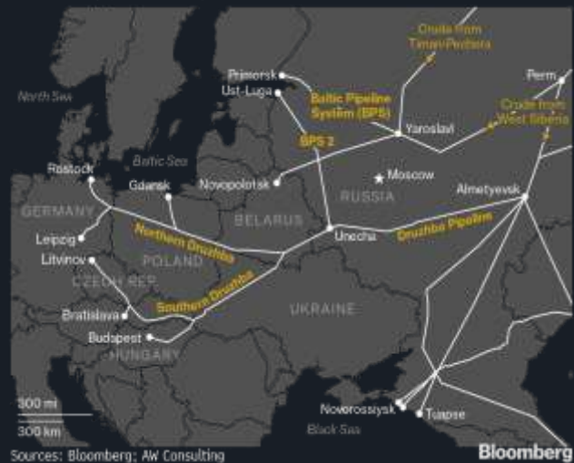
Mreža ruskih naftovoda i lukičkih terminala u Evropi

Razlog zašto je rekordan uvoz Evrope preko glavnih kupaca ruske nafte, Kine, Indije, Turske, Ujedinjenih Arapskih Emirata (UAE) i Singapura – ukazuje Centar za istraživanje energije i čistog zraka (CREA) u svom novom izveštaju nazivajući tih pet zemalja „praonicama goriva“.