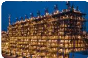
PREKUPO I KINEZIMA