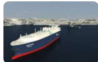
MOSKVA OTVARA LNG IZVOZ?