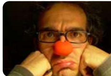
AMATERIZAM NA NYSE