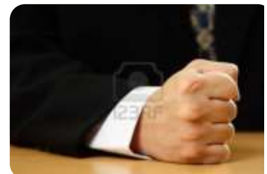
MOL-INA ... BURA?