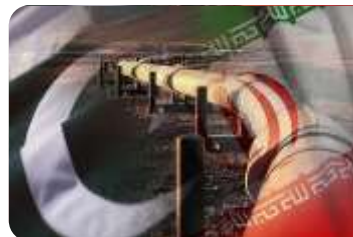
IRANSKI GAS U EU?!