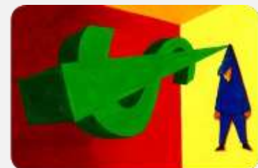
POREZNICI JURE INU