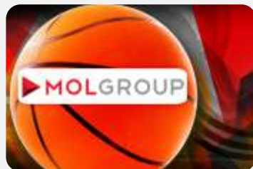
MOL PRODAO RUSKO POLJE