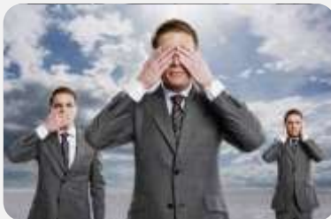
EU: NEKOM MAJKA ...