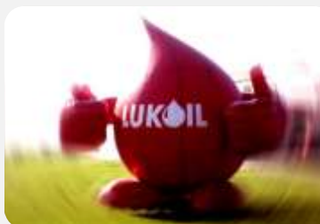
LUKOIL U SAUDI ARABIJI