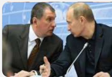
SEČIN ZA MADE IN RUSSIA