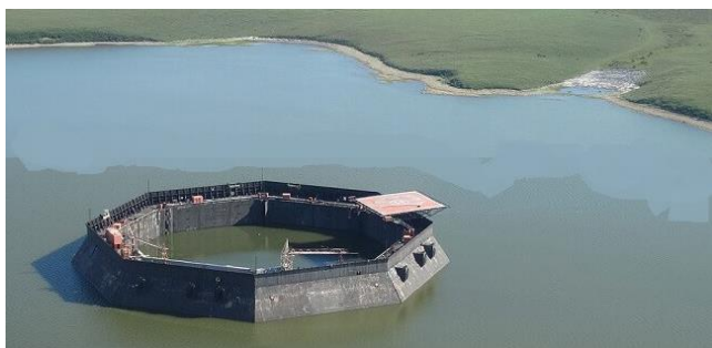
Napuštena naftna platforma na severozapadu Kanade

Kompanija će u drugom tromesečju sprovesti otpise aktive u, kako se procenjuje, rasponu od 13 do 17,5 milijardi dolara nakon oporezivanja. To bi moglo povećati gearing - odnos između neto duga i kapitala kompanije - ka 50%, daleko najviše u industriji, rekao je analitičar RBC-a Biraj Borkhataria.