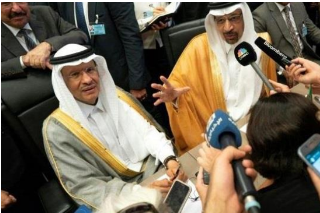
Al Falih, desno i njegov naslednik, Abdulaziz bin Salman, levo

Na oba položaja došli su ljudi odani svemoćnom princu prestolonasledniku Mohamedu bin Salmanu (34), s tim što je prvi put za ministra energetike imenovan jedan član kraljevske porodice, četvrti sin kralja Salmana, Abdulaziz bin Salman (59).