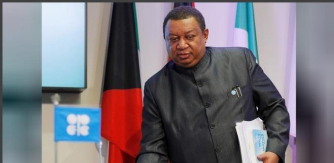
GenSek OPEC-a Mohamed Barkindo

LONDON/HJUSTON – OPEC će u ponedjeljak, 5. Marta organizovati u Hjustonu večeru sa čelnicima američkih proizvođača nafte iz škrljaca, saznaje Reuters iz dva industrijska izvora.