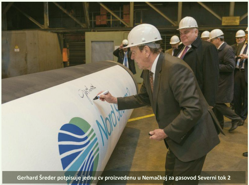
Gerhard Šreder potpisuje jednu cv proizvedenu u Nemačkoj za gasovod Severni tok 2

EUobserver podseća da je pre tri godine Evropska komisija uspela da nametne projektu gasovoda Južni tok argumente koje sada aktivira za Severni tok 2, „uz jednu razliku“ na koju ukazuje Stefan Meister, ekspert za Rusiju u nemačkom ministarstvu spoljnih poslova: „Ključnu razliku između Severnog toka 2 i Južnog toka predstavlja moć Nemačke. Nemačka vlada je bila uključena u postupak blokiranja Južnog toka, za razliku od NS2, gde su zemlje kritičari preslabe,“ kaže Meister.