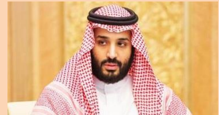
Princ Mohamed bin Salman

iznenadio je mnoge brzinom sa kojom je izrastao u najuticajnijiu ličnost ove monarhije, posle svog oca, kralja Salmana. Sin kralja Salmana i njegove treće supruge Fahde bint Falah, MbS - kako ga skraćeno imenuju u diplomatskim krugovima Rijada - postao je sa samo 30 godina života u zemlji gde tradicionalno rukovode šefovi režima u starosti 70 do 80 godina, ministar odbrane, ekonomski car, čelnik kraljevskog suda i vrhovni gospodar spoljne i naftne politike te zemlje.