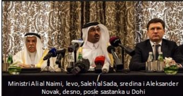
Ministri Ali al Naimi, levo, Saleh al Sada, sredina i Aleksander Novak, desno, posle sastanka u Dohi

DOHA – Tri članice OPEC, Saudijska Arabija, Katar i Venecuela, kao i Rusija spremne su da zamrznu proizvodnju nafte na nivou iz januara, saopšteno je u utorak posle sastanaka resornih ministara ove četiri države u Dohi. Odluka predstavlja plan, koji će biti realizovan kada i ako ga prihvati Iran, pa onda ostale OPEC i ključne ne-OPEC zemlje.