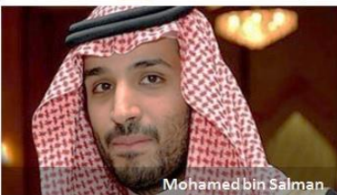
Mohamed bin Salman

te petro-monarhije, rekao je predsednik saudijskog državnog kolosa televiziji Al-Arabiya . „Rezerve se neće prodavati, ali se razmatra (prodaja udela vezanih za) sposobnost kompanije da proizvodi iz tih rezervi,“ rekao je Halid al Falih. Aramco raspolaže sa rezervama sirove nafte procenjenim na oko 265 milijardi barela, što je preko 15% ukupnih rezervi ove sirovine u svetu. Ukoliko se razmatranje javne prodaje aktive obistini, Saudi Aramco bi u tom slučaju bio prva na berzi izlistana kompanija sa vrednošću iznad 1 biliona dolara koja se odlučuje na IPO, piše Reuters .