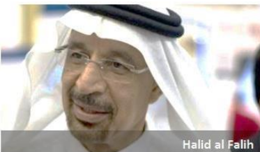
Halid al Falih

RIJAD - Inicijalna javna ponuda aktive (IPO) najvećeg svetskog proizvođača nafte, Saudi Aramco-a, mogla bi se organizovati bilo na domaćoj, ili međunarodnim berzama, ali neće obuhvatiti rezerve nafte