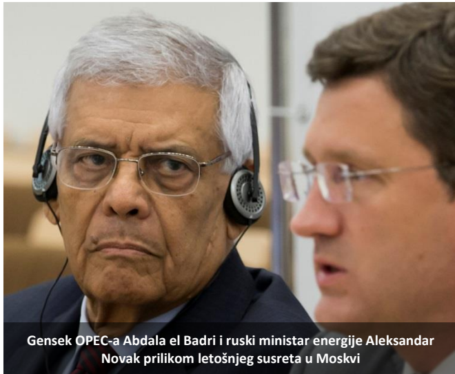
Gensok OPEC-a Abdala el Badri i ruski ministar energije Aleksandar Novak prilikom letošnjeg susreta u Moskvi

HOBAR, Saudijska Arabija - Saudijska vlada saopštila je u ponedjeljak da je spremna da sarađuje sa OPEC i ne-OPEC proizvođačima nafte „radi stabilizacije tržišta“, a Reuters dodaje da ova izjava dolazi desetak dana pre ministarskog sastanka naftnog kartela (4. decembar) na kome treba da se revidiraju efekti cenovne strategije ove grupacije. Iako do kraja nedefinisan, stav vlade je odmah doveo do skoka cena nafte za jedan dolar.