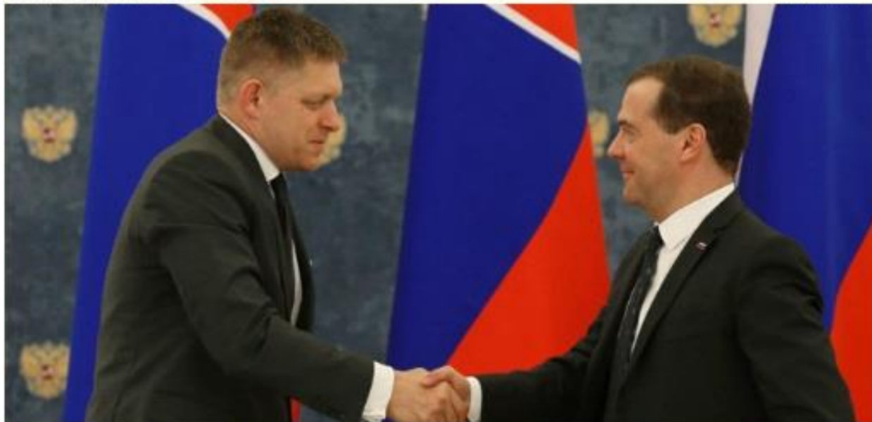
Russian Prime Minister Dmitry Medvedev (R) and his Slovak counterpart Robert Fico after a joint news conference following Russian-Slovak talks, in the Gorki residence.

MOSKVA - Slovački premijer Robert Fico predložio je ruskoj vladi izgradnju novog gasovoda kojim bi se ruski gas transportovao u Srednju i Istočnu Evropu. On je ruskom premijeru Dmitriju Medvedevu predložio izgradnju cevovoda koji bi se spojio na budući gasovod Turski tok i uključio Tursku, Bugarsku, Rumuniju, Mađarsku i Slovačku. Projekat bi bio izgrađen i ugovoren tako da ga podrži Evropska komisija i da bude sufinansiran sredstvima Evropske unije . RIA Novosti