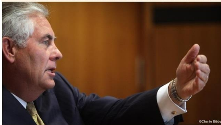
Rex Tillerson, CEO of ExxonMobil