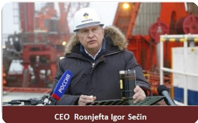
CEO Rosnjefta Igor Sečín

MOSKVA – Rosnjeft traži alternativne puteve za razvoj izvora nafte i gasa u ruskim vodama Arktika, pošto je američki ExxonMobil morao da se povinuje sankcijama Zapada i suspenduje sprovođenje strateškog dogovora koji je bio potpisao sa ruskim državnim naftnim kolosom, saopšteno je iz vlade u Moskvi. Ministar Rusije za prirodna bogatstva Sergej Donskoj rekao je u utorak na press konferenciji da je Rosnjeft pozvao kineske kompanije da učestvuju u ovim projektima. On je dodao da Rosnjeft namerava da objavi planove razvoja arktičkog projekta pre kraja ove godine. Upstream