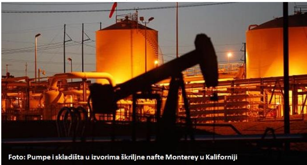
Foto: Pumpe i skladišta u izvorima škriljne nafte Monterey u Kaliforniji

PARIZ - Niske cene nafte mogle bi smanjiti dogodne investicije u proizvodnju škriljne nafte u SAD za deset odsto, smatra Međunarodna agencija za energiju (IEA). Glavni ekonomista IEA, Fatih Birol rekao je