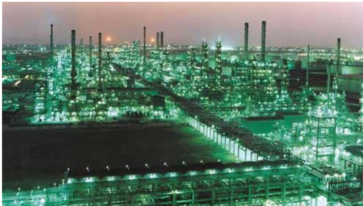
Rafinerija Mina Al Ahmadi (foto) biće modernizovana i integrisana sa obližnjom rafinerijom Mina Abdullah u okviru projekta Kuwait's Clean Fuels

KUVAJT SITI – Kuvajt će da investira do 2018. godine više od 17 milijardi dolara u razvoj rafinerija nafte u sklopu projekta „ekološkog goriva“. Osim ekoloških efekata, projekat će