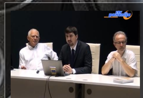
TRIBINA KOMITETA MLADIH NNKS Prve aktivnosti Komiteta mladih - Na portalu wpcserbia.rs --

Najveća američka banka Morgan Stanley saopštila je da ne veruje da će sankcije blokirati ranije dogovorenu prodaju Rosnjeftu njenih poslova trgovine naftom. Reuters s druge strane javlja da sankcije neće omesti ni Rosnjeftovu prodaju nafte.