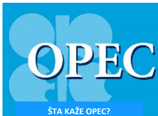
ŠTA KAŽE OPEC?