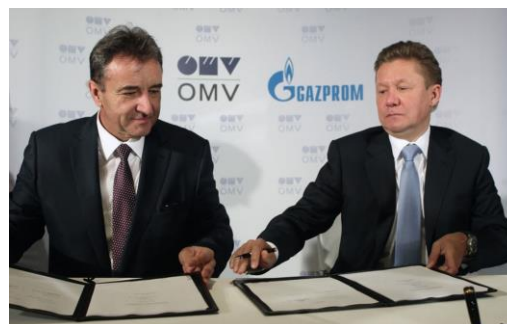
OMV SIGURAN U JUŽNI TOK