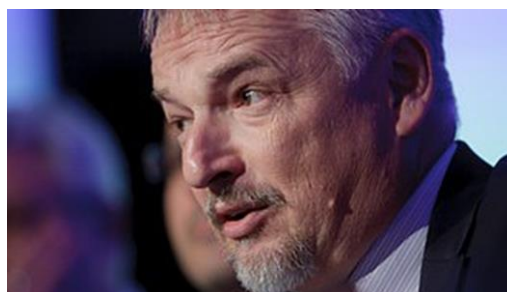
NOVI OBLACI NAD ČELNIKOM MOLA