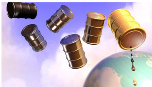
KREĆE IZVOZ AMERIČKE NAFTI