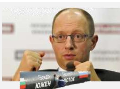
JUŽNI TOK ADUT BRISELA?