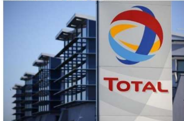
View of the logo of French oil giant Total in front of the oil refinery of Donges, near Nantes, December 20, 2013.

0 COMMENTS | Tweet | Link this | Share this | Email | Print