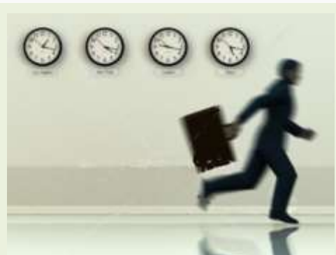
TOTAL I E.ON BEŽE IZ TAP-A