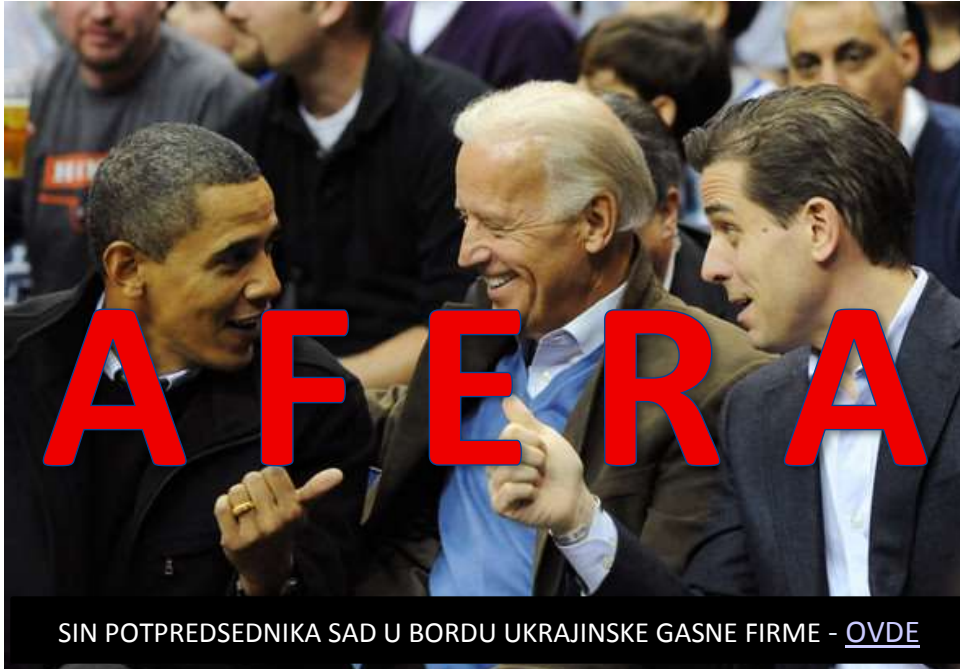
SIN POTPRESEDNIKA SAD U BORDU UKRAJINSKE GASNE FIRME - OVDE