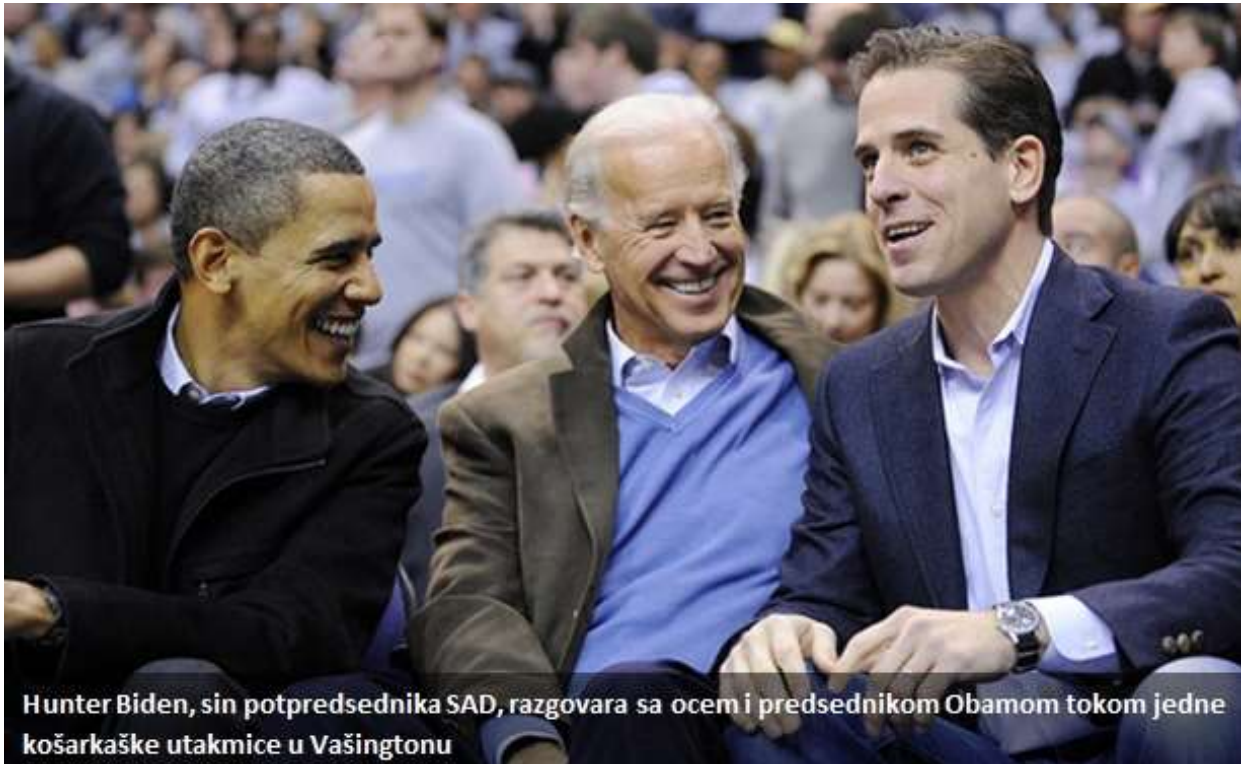
Hunter Biden, sin potpredsednika SAD, razgovara sa ocem i predsednikom Obamom tokom jedne košarkaške utakmice u Vašingtonu