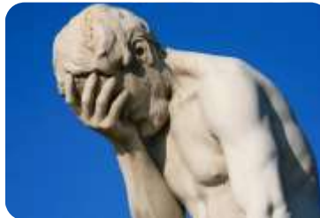
TOTAL: KAŠAGAN BLOKIRAN