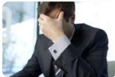
NOVI PAD EU RAFINERIJA