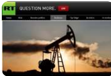
MEGA POLJE U ASTRAHANU?