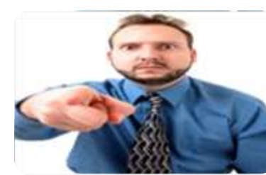
BUGARSKA PRETI BRISELU

Informacije objavljene u ovom pregledu ne treba nužno tumačiti kao stav, ili opredeljenje NNKS prema temama kojima se bave