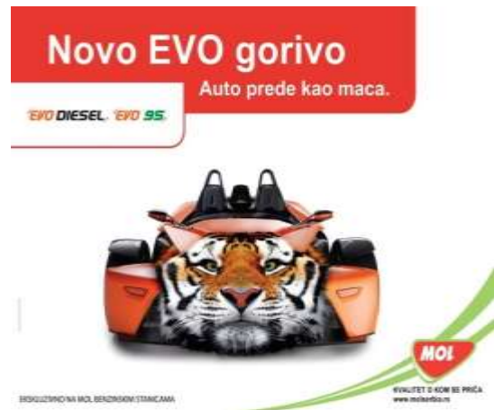
MOL's network of petrol stations

BUDIMPEŠTA – Grupa MOL kupuje 124 benzinske stanice (BS) Agip-a u Češkoj republici od italijanskog Enija, objavio je u sredu praški dnevnik Hospodárské Noviny, pozivajući se na pouzdane izvore. MOL će u toj zemlji posle ove kupovine posedovati mrežu od 273 BS i zauzeti drugo mesto na češkom tržištu derivata, posle lanca brenda Benzina, čiji je vlasnik poljski PKN Orlen, preko češke podfirme Unipetrol. List navodi da MOL neće platiti u gotovini kupovinu pumpi, već će ih zameniti za rafineriju nafte Mantova u Italiji i neke od BS koje poseduje u toj zemlji. Ni Eni ni MOL nisu želeli da komentarišu za Portfolio.hu ovu vest.