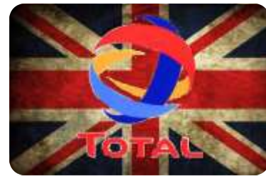
TOTAL # 1 U BRITANIJU