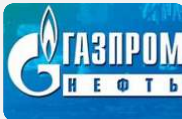
50% U SEVERENERGIA