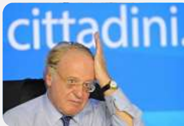
CEO ENI PRED ZATVOROM?