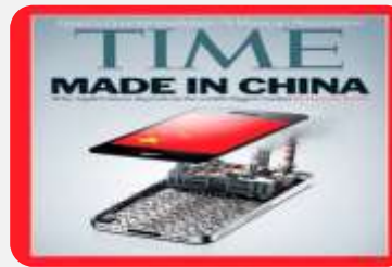
SHELL: KINESKO JEFTINIJE