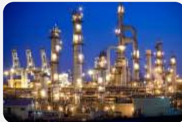
EVROPA: GDE SU REŠENJA?