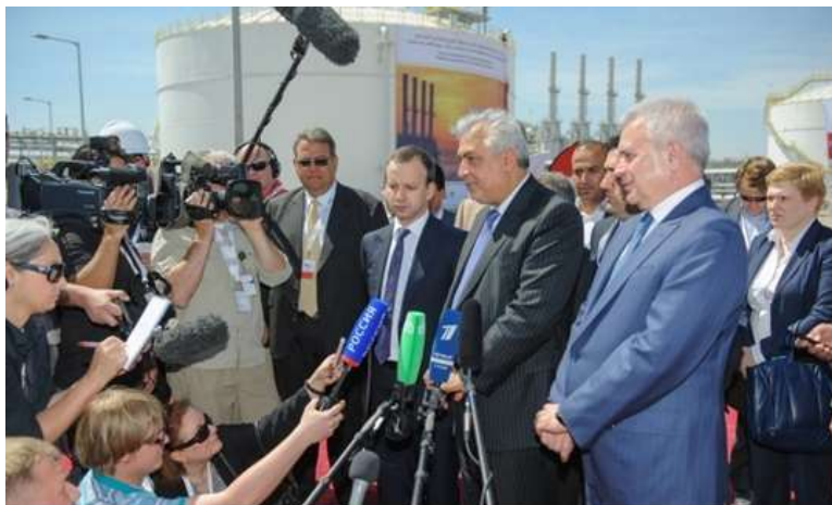
V. Alekperov, prvi s desna, u društvu vicepremijera Iraka i Rusije, Huseina al Šahristanija i Arkadija Dvorkoviča

BASRA - Lukoil je 29. marta svečano obeležio početak proizvodnju nafte iz projekta Zapadna Kurna 2 u Iraku, ritmom od 120 hiljada barela na dan. Kako je saopšteno iz kompanije, dostizanje i održavanje tog nivoa proizvodnje u toku 90 kalendarskih dana predstavlja obavezan uslov da bi investicije mogle postati isplativima. Predsednik ruskog naftaša, Vagit Alekperov rekao je da su puštanje nalazišta u rad u kratkom roku i izlazak na projektovani nivo proizvodnje potvrdili sposobnost Lukoila da samostalno upravlja realizacijom složenih kapitalnih projekata i da se učvrsti na poziciji globalne energetske kompanije. Zapadna Kurna-2 je jedno od najvećih svetskih nalazišta nafte sa geološkim zalihama od 35 milijardi barela, raspoređenim u dve formacije Mišrif i Jamama. Projekat