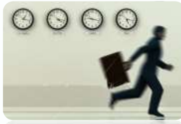
A TOTAL BEŽI IZ ŠAH DENIZA