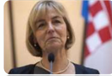
ZAGREB BRANI JUŽ. TOK