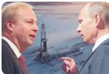
BIG OIL OSTAJE U RUSIJI