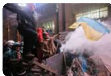
EU NE PLANIRA SANKCIJE?