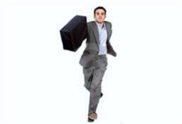
OMV OPET ŽELI U JUŽNI TOK?