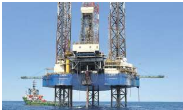
Inina platforma Labin, sagrađena u Rijeci 1985.

ZAGREB - Ministarstvo privrede Hrvatske objavilo je 24. formiranje Agencija za ugljikovodike i najavilo za april raspisivanje tendera za koncesionu eksploataciju naftno-gasnih polja u Jadranu. Razrađen je i finansijski model koji obuhvata fiksnu novčanu naknadu državi i podelu proizvedenih količina gasa i nafte, o čemu će Vlada raspravljati narednih dana, rekao je ministar privrede Ivan Vrdoljak. On kaže da u odnosu na trenutni model, koji je baziran isključivo na novčanoj naknadi, država u ovom prolazi znatno bolje. Prema simulaciji koju je predstavio u ponedjeljak novinarima, udeo koji će da ide državi, uključujući i podelu proizvodnje, je 60% kod gasa i 54% kod nafte, dok danas državi pripada 24%. Vrdoljak navodi da je prošle godine taj