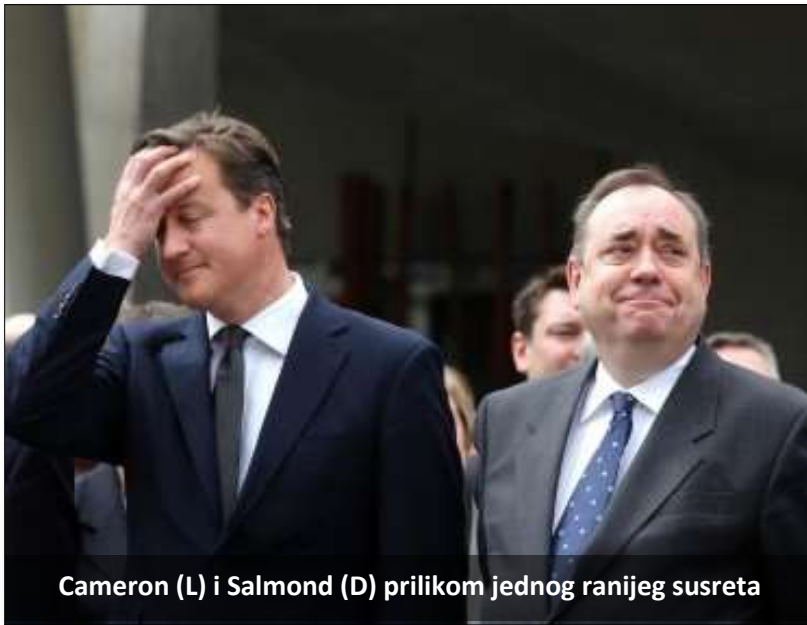
Cameron (L) i Salmond (D) prilikom jednog ranijeg susreta

LONDON – Vlade Škotske i Britanije iznele su ove nedelje oprečna gledanja na buduću eksploataciju nafte iz Severnog mora, što je uz valutu i članstvo u Evropskoj uniji centralno pitanje kampanje za škotski referendum o nezavisnosti koji će se održati 18. septembra. Premijer Škotske Alex Salmond rekao je u ponedjeljak da bi nezavisna Škotska trebalo da sledi primer Norveške u naftnoj politici, dok njegov britanski kolega David Cameron konstatovao istog dana u Aberdinu, posle prve sednice svoje vlade održane u