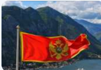
CG: UPSTREAM POREZ 59%