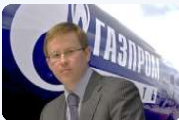
2020. OUTPUT 100 MIL.TONA