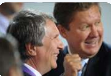
ROSNJEFTOV GASNI PLAN