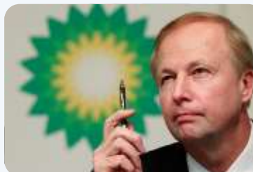
BP: BIĆE NAFTE DO 2050.