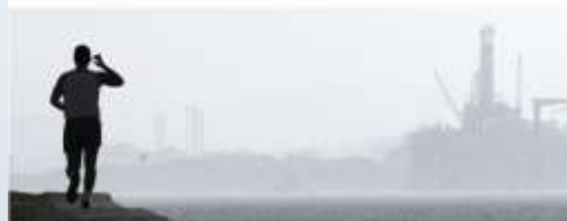
Brent and WTI Crude Oil Again Parting Ways

VAŠINGTON - Američki naftni institut (API) založio se za odobrenje izvoza jeftine američke sirove nafte navodeći da bi to moglo uštedeti do 6,6 mlrd. dolara američkim potrošačima godišnje do 2020. godine. Naime, API u upravo objavljenom izveštaju objašnjava da bi izvoz po višim svetskim cenama doneo novih 70 milijardi dolara ulaganja u američki upstream sektor do 2020., što bi obezbedilo zemlji proizvodnju dodatnih 500.000 barela na dan. UPI