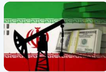
IRAN: NA LETO UGOVORI