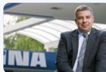
I ČELNIK INE U SPORU?