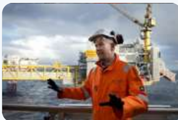
STATOIL: PONESTAJE NAFTE