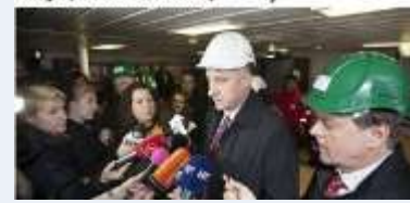
VRDOLJAK: HRVATSKA MALA NORVEŠKA

Norvežani objavili rezultate istraživanja: Hrvatska bi mogla postati novi naftni i plinski raj