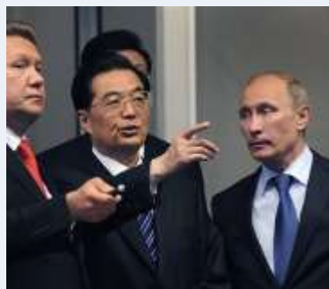
GASPROM: UGOVOR SA KINEZIMA U MAJU

LUKOIL, Gazprom to Continue Gas Cooperation Report