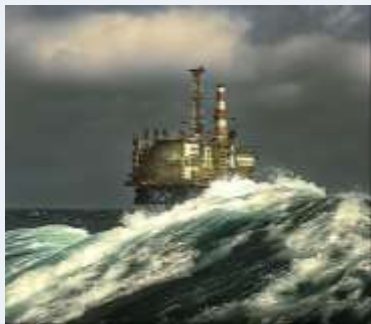
OMV : MNOGO PRODAVACA NA SEVERNOM MORU