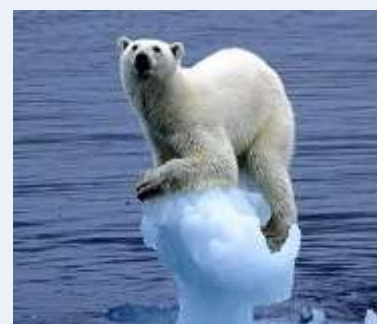
ARCTIK: GRENLAND BEZ LICENCI – SHELL BLOKIRAN