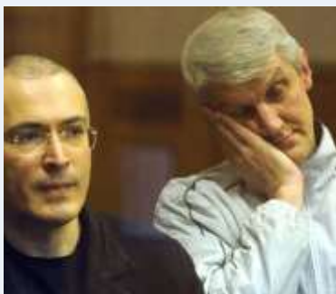
LEBEDEV FREE – HODORKOVSKI DUŽAN