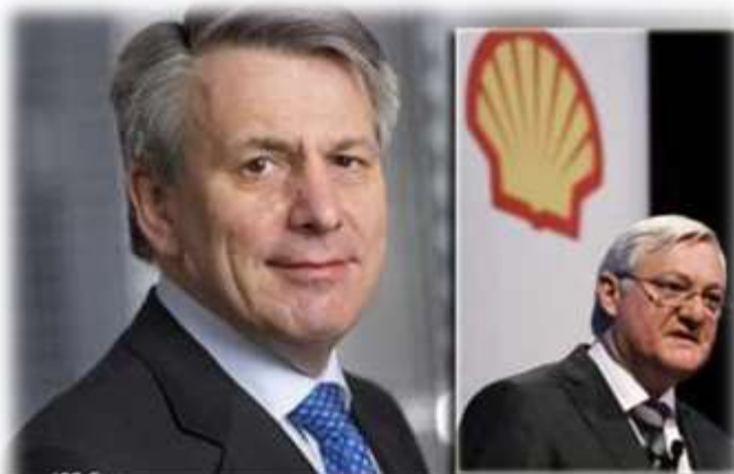
Ben van Beurden (levo) je 1. januara nasledio na kormilu kompanije Petera Vosera (desno), sa pozicije direktora prerađivačkog i marketinškog sektora Shell-a

LONDON – Shell u naredne dve godine planira da proda poslove u vrednosti 15 milijardi dolara, uključujući neka polja u Severnom moru, objavio je u utorak Financial Times . Kompanija na čije je čelo početkom januara došao Ben van Beurden, planira prodaju dela prerađivačkog portfolija i neke projekte u ranim fazama razvoja, prenosi londonski poslovnik citirajući izvor blizak trećoj najvećoj naftnoj kompaniji na svetu. Anglo-holandska kompanija je u oktobru najavila značajno rasterećenje portfolija tokom ove i 2015. godine, posle procene da su ulaganja u 2013. dostigla rekordnih 45 milijardi dolara. Analitičari nagađaju da bi na doboš mogli da idu neka Shell-ova naftna polja u Nigeriji kao i udeo od 23% u australijskoj kompaniji Woodside Petroleum – vrednosti preko 6 milijardi dolara.