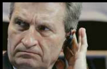
POSLEDNJA VEST: ETINGER PREGOVARA O JUŽNOM TOKU