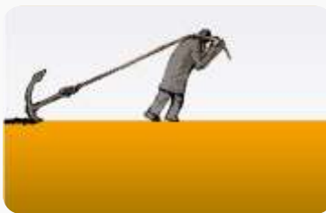
BAKU-NOVOROSIJSK SE GASI