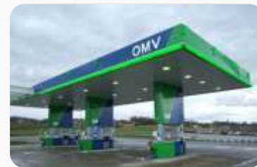
DRŽAVA SMANJUJE UDEO?