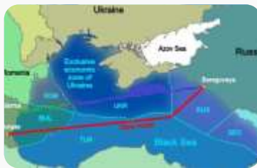
JUŽNI TOK: PRVI KOMPRESOR