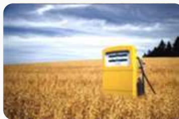
EU: BIOGORIVA BEZ REŠENJA