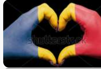
RUMUNIJA ODLAŽE AKCIZU