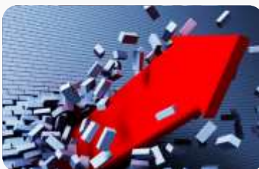
IEA: VIŠAK RAFINERIJA