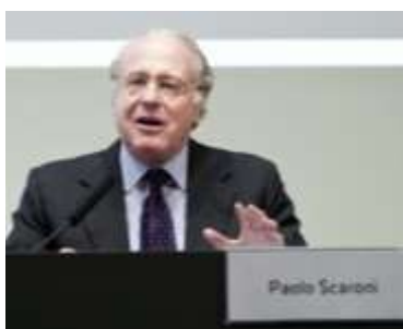
STATOILOV GAS SKUPLJI