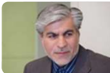
IRAN NA ČELU" GASOPECA"