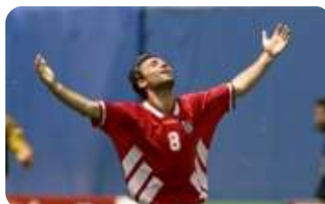
J.TOK: USTUPCI SOFIJI