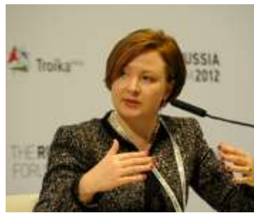
KIJEVU GODINU DANA