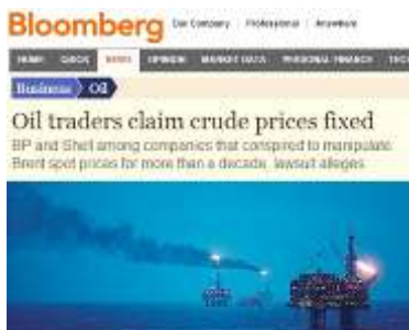
CENE BRENTA NAMEŠTANE!