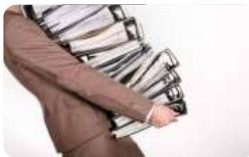
LUKOIL CROATIA: 2.DEO