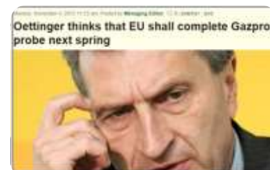
GAZPROMU NA PROLEĆE