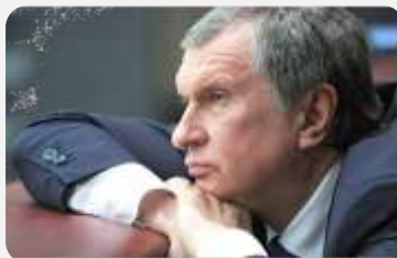
SEĆIN TRAŽI LUKE ...