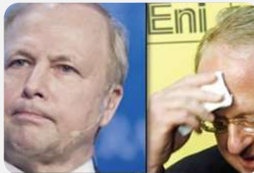
ODGOVOR NA PAD PROFITA