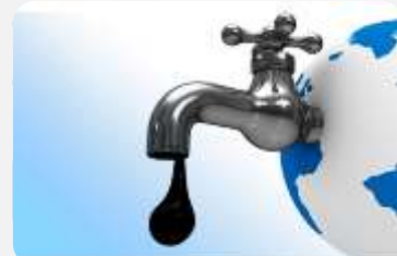
OMV: SUV IZVOR