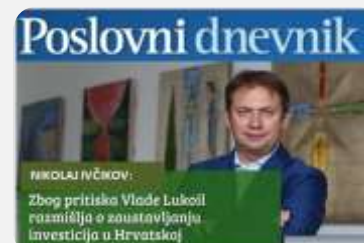
LUKOIL NAPUŠTA HRVATSKU?