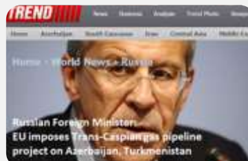
LAVROV UPOZORAVA EU