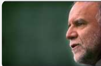
WELCOME TO IRAN E&P