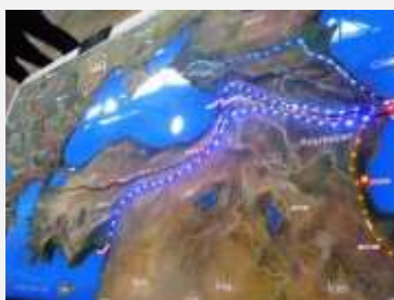
POLITIKA OKO GASOVODA