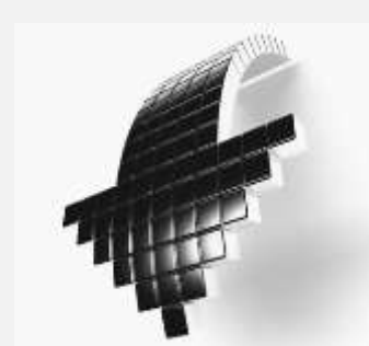
2013: ZA ZABORAV