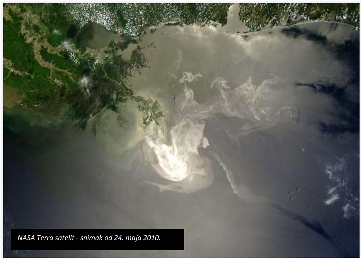
NASA Terra satelit - snimak od 24. maja 2010.

HJUSTON – Kompaniji BP preti kazna do 18 milijardi dolara u drugoj rundi parničenja za nadoknadu štete