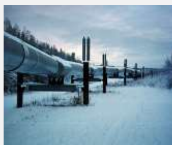
TRANSNJEFT: NE ROSNJEFTU