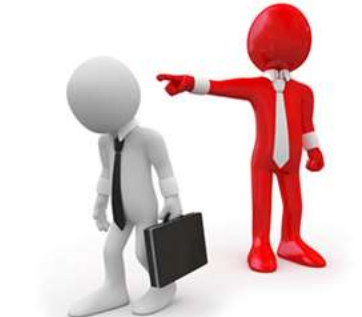
INA: OTKAZ I KOFERČE €