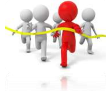
KOME AKCIJE PETROLA?