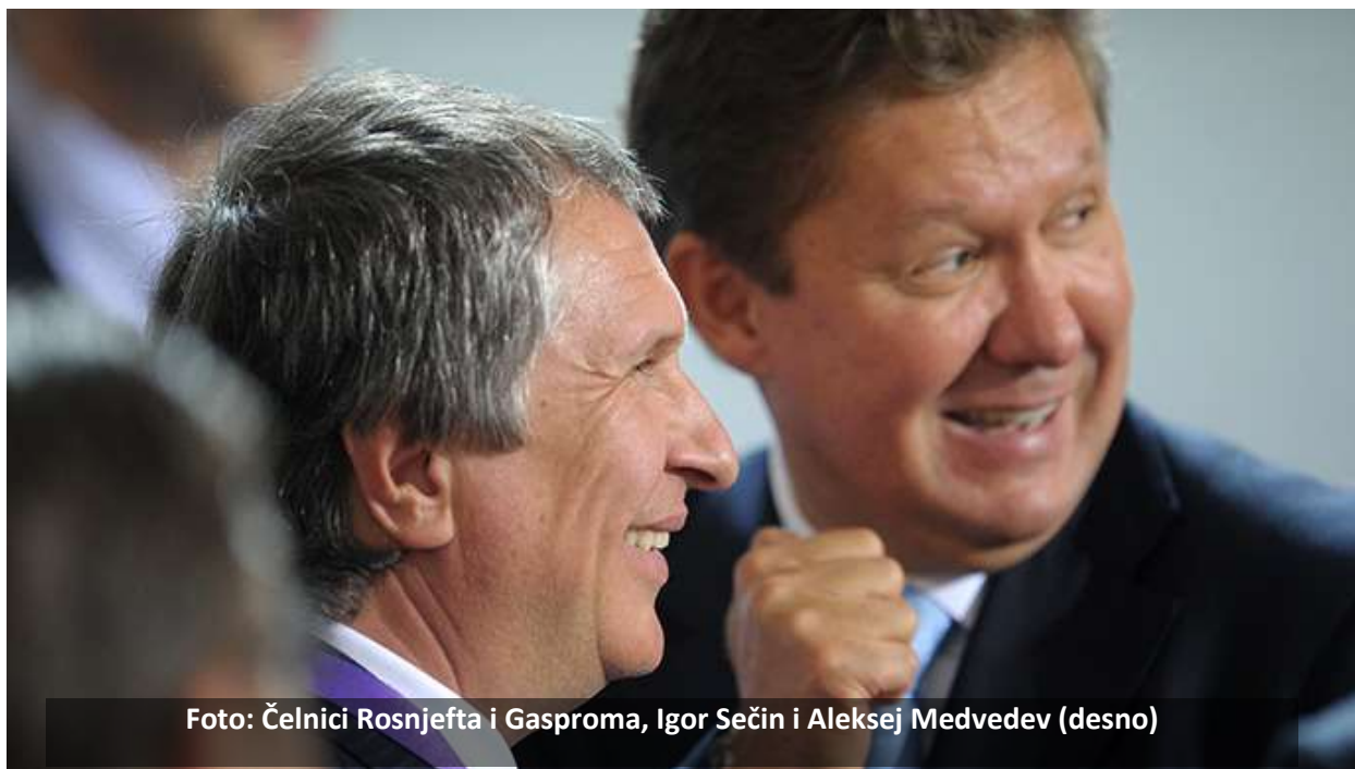
Foto: Čelnici Rosnjefta i Gasproma, Igor Sečin i Aleksej Medvedev (desno)

MOSKVA – Gasprom smatra baltičku luku Ust-Luga najboljom lokacijom za novi LNG pogon, rekao je potpredsednik kompanije Valerij Golubjev, demantujući glasine da bi izbor mogao biti neka luka na ruskom dalekom istoku, Kako je preneo Kommersant , Golubjev je kao prednosti Ust-Luge naveo već postojeće brodske transportne pravce i bolje klimatske uslove. Planirana LNG fabrika bila bi kapaciteta 10 miliona tona godišnje, koštala bi 5-7 milijardi dolara i proradila bi 2018.