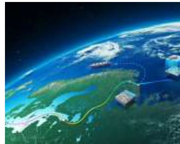
GAZPROMU CEO ŠTOKMAN?