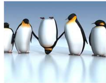
KIJEV: KAKO PREUSMERITI GASOVODE?