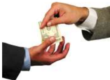
NAFTA PETROCHEM PRODATA?