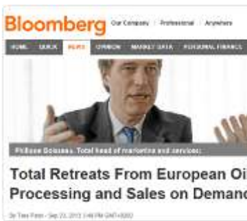
TOTAL: ADIEUX EUROPE

ROSNJEFT SVE AGRESIVNIJI NA RUSKOJ GASNOJ SCENI ( VIDI )