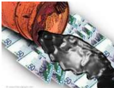
RUMUNIJA DIŽE RENTU