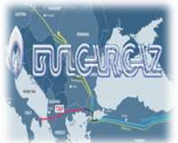
BULGARGAZ NA DVE STOLICE