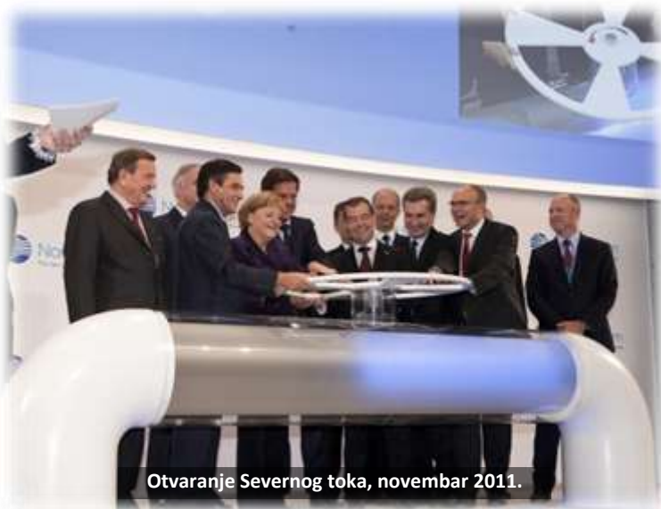
Otvaranje Severnog toka, novembar 2011.

„Vidimo mogućnosti za proširenje Severnog toka“, rekao je izvršni direktor Gazproma Aleksej Miler. „Nova cev, kapaciteta od oko 27,5 milijardi kubnih metara, bi mogla biti produžena na nova tržišta i prvi put povezati Rusiju sa Velikom Birtanijom“, citira Milera Wall Street Journal . Ključno je potpisati dugoročne ugovore sa našim britanskim partnerima o uvozu gasa na tržište te zemlje, rekao je Milerm novinarima u Amsterdamu, gde je bio u pratnji ruskog predsednika Putina tokom posete Holandiji.