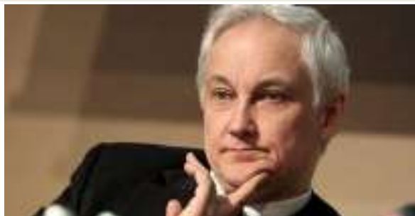
Belousov: Ove godine početi prodaju Rosnjefta

MOSKVA - Ruska vlada bi do kraja godine mogla da proda još 19% udela u državnoj naftnoj kompaniji Rosnjeft, u sklopu planova o ubrzanom privatizaciji pojedinih državnih preduzeća, rekao je u četvrtak, 11. aprila, ministar privrede Andrej Belousov. "Na sednici Vlade spomenuo sam da moramo ubrzati opsežni proces privatizacije", rekao je Belousov novinarima posle sastanka. Vlada već dugo razmatra mogućnost prodaje udela u Rosnjeftu, čija je tržišna vrednost 77,5 milijardi dolara. Belousov podseća da je vlada već prodala