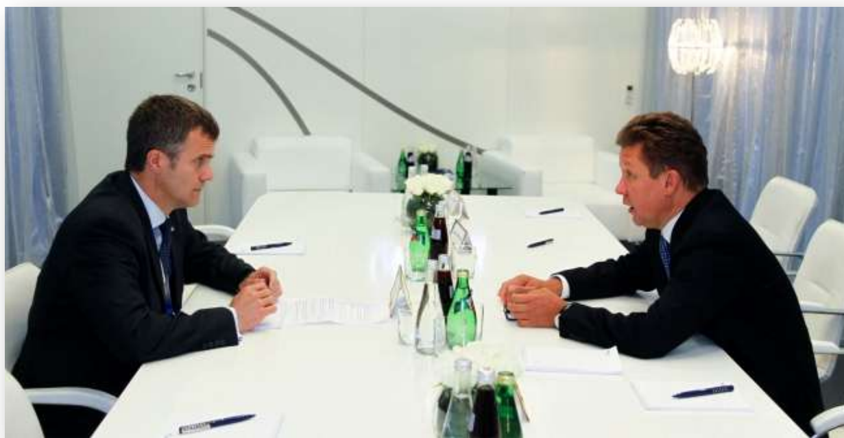
Foto: Čelnici Statoila, Helge Lund (levo) i Aleksej Miler prilikom jednog sastanka

MOSKVA - Neto profit Gasproma udvostručen je u 3. kvartalu na preko 10 milijardi dolara, zbog većih prodaja, ali je dobit kompanije u celini za prvih devet meseci 2012. smanjena 12%, na 27,1 mlrd.$, saopšteno je 17. januara iz sedišta ruskog gasnog kolosa. Neto profit u 3. kvartalu 2012. iznosio je 305,05 milijardi rubalja (10,05 mlrd. $), naspram 152 mlrd. RUB u istom periodu 2011. Ukupne prodaje u 3. kvartalu iznosile su 1,12 biliona RUB