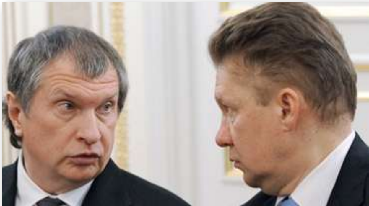
Na slici: Čelnici Rosnjefta i Gasproma, Igor Sećin (levo) i Aleksej Miler

privatne kompanije mogle dobiti licence za koje nisu zainteresovana dva državna energetska kolosa. Plan takođe predviđa da u slučaju otkrića velikih ležišta privatna firma mora da dozvoli opciju 50% + 1 udela u nalazištu državnoj kompaniji. Čelnik Rosnjefta, Igor Sećin je promenio raniji stav i, kako prenosi RIA Novosti, rekao: Pošto je odluka vlade doneta, mi ćemo je slediti,